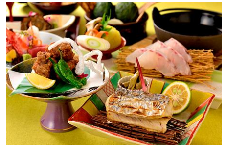
神戸 たむら 料理イメージ