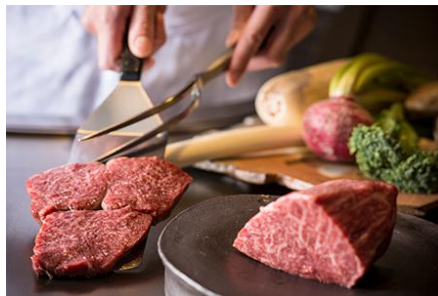
但馬 料理イメージ