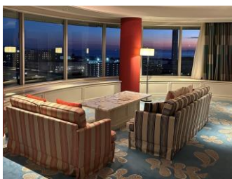
南館プレジデンシャルスイート（2名ご宿泊時）