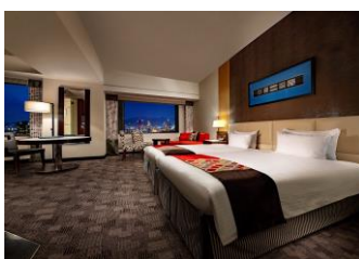
本館ハーバービューデラックスルーム