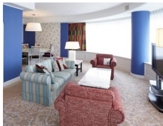
南館レジデンシャルスイート（3～4名ご宿泊時）