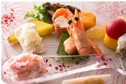
聚景園 料理イメージ